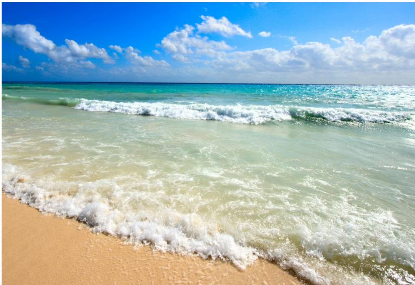
BEZPIECZNE WAKACJE – zabawa „Zagadkowy pociąg” – ilustracja 1 z 6