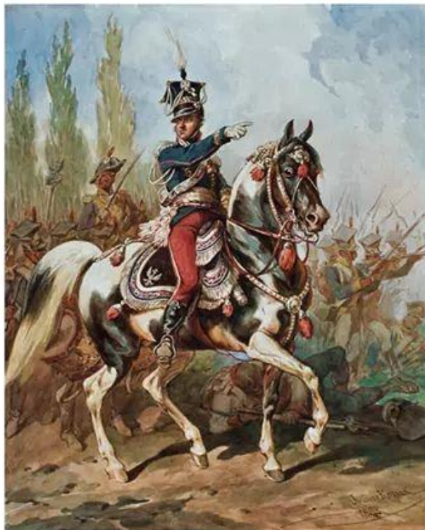
Gen. Jan Henryk Dąbrowski na czele Legionów

Hymnem Rzeczypospolitej Polski jest "Mazurek Dąbrowskiego". W 1797 roku poeta Józef Wybicki napisał "Pieśń Legionów Polskich we Włoszech", którą na cześć generała Dąbrowskiego nazwano "Mazurkiem Dąbrowskiego". Początkowo hymn składał się z 6 zwrotek, 26 lutego 1927 roku Ministerstwo Spraw Wewnętrznych ogłosiło, że jest to hymn Polski.