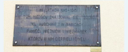
Pamiętnikowa tablica w miejscu byłego podobozu w Babicach, obecnie w tym miejscu znajduje się m.in. przedszkole.

W kwietniu minie 75 lat od chwili, gdy niemieccy okupanci wysiedlili miejscową, polską ludność z Babic. Babiczanie zostali deportowani na Śląsk i do okolicznych miejscowości. Musieli zostawić dorobek życia, gospodarstwa, sprzęt rolniczy i inwentarz.