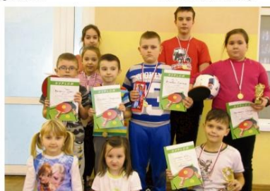
(Ior)