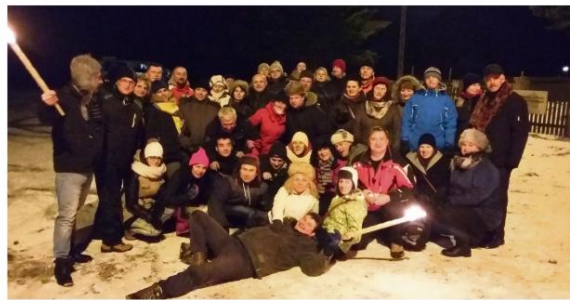
Na kulgu w Wiśle.