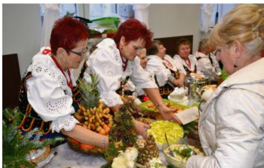
KGW z Broszkowic, Stoły Wigilijne Grojec 2013 r.