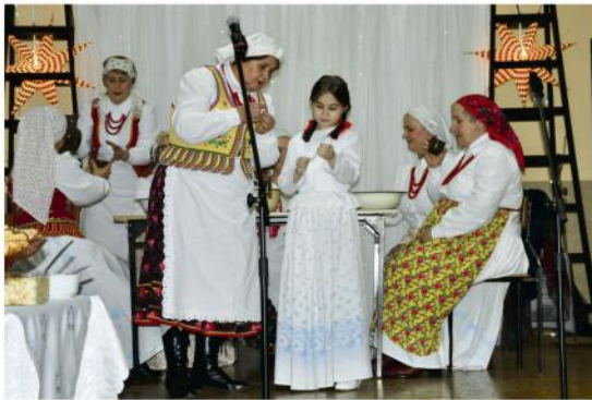
Stoły Wigilijne w Grojcu, 2018 r.

jest położona łuska z karpia. Zauważa, że Boże Narodzenie to Gody, czyli Godne Święta. Różne regiony identyfikują się z tą nazwą – Śląsk i Małopolska. Zgódźmy się zatem, że i u nas jest na miejscu.