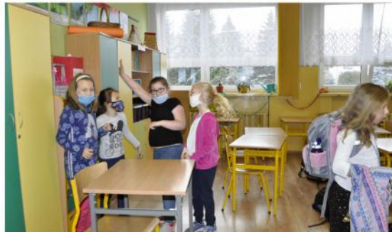
Szkolna świetlica w Groju tętni życiem.

Odnowienia sali gimnastycznej w Babicach nie można było dłużej odkładać, tym bardziej, że przecież co najmniej do połowy stycznia nie ma wu-efu, nie wspominając o uroczystościach i akademiach. Remont, który będzie kosztował ponad 36 tys. złotych,