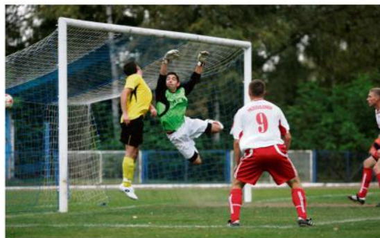
Pierwsze sparingi przed rundą rewanżową zaplanowano już na koniec stycznia i początek lutego przyszłego roku.

ekipa prowadzona przez Rafała Skrzypla nie poniosła żadnych strat. Przy ulicy Sportowej mogą więc już teraz myśleć o zakupie szampanów.