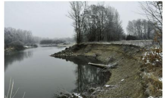
Skarpa na przysiółku Czajki zostanie wzmocniona jeszcze w tym roku.

Od zeszłego roku Wody Polskie realizują projekt zabezpieczenia przeciwpowodziowego tzw. Węzła Oświęcimskiego. Kilka zadań inwestycyjnych jest prowadzonych równocześnie w dwóch powiatach: oświęcimskim i chrzanowskim. Dla nas szczególnie ważna jest rozbudowa wałów w Broszkowicach, Babi-