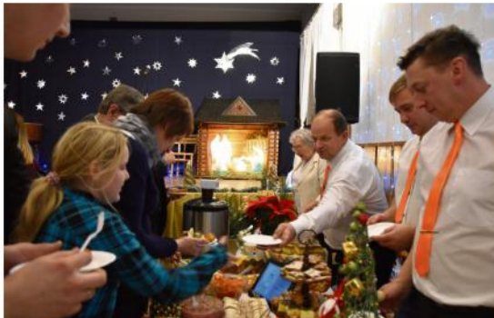
UKW Włosienica, Stoły Wigilijne w Porębie Wielkiej, 2016 r.

A zasiadłszy do stołu w godzinę zmierzchniową,