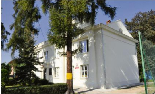
Szkola w Harmężach mieści się w zabytkowym budynku. Jego elewacja czekała na remont wiele lat.

Ponad stu właściciele domów dostało dotację do wymiany pieca. Gmina sfinansuje również w jednej trzeciej nowy wóz bojowy OSP Włosienica. Zgodnie z tegorocznym planem zaakozono trzy kosztowne inwestycje w Brzezince w ramach Oświęcimskiego Strategicznego Programu Rządowego: budowę nowej drogi łączącej ulice Komendantów i Piwniczną, przebudowę Wierzbowej obejmującą kanalizację sanitarną oraz dokończenie budowy drogi odbarczającej.