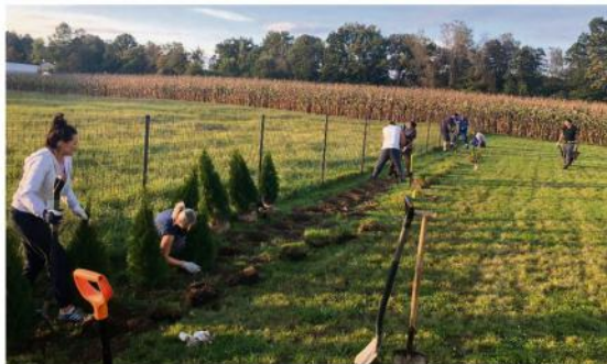
Rodzice sadzili tuje przy szkole w Porębie Wielkiej jeszcze w październiku.